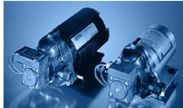
Premium Pump w/ cooling fins

AGUA, CERVEZA. LIQUIDO DEBE ESTAR FILTRADO PARA OPERAR